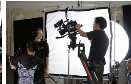
Abb. 7.2.2 Einsatz der Alexa 35 an einem Jilbarn