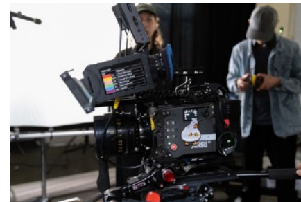
Abb. 7.2.1 ARRI Alexa 35 mit Cooke S4 Prime-Optik

Spielraum habe. Interessant war für mich, dass ich eine sehr moderne Kamera nutze, aber trotzdem versuche, das Bild nicht „zu perfekt“ aussehen zu lassen. Bei den Objektiven habe ich bewusst gemischt. Die Cooke S4 Primes habe ich in intimen Szenen eingesetzt, weil sie weicher zeichnen und Haut weniger klinisch wirken lassen. Die Sigma Zoom-Objektive waren praktischer bei bewegteren Situationen. Man merkt im direkten Vergleich, wie stark Objektive das Bildgefühl verändern. Auch bei der Kameraführung habe ich bewusst nicht alles stabilisiert. In emotionalen Momenten bin ich auf die Schulter gegangen und habe kleine Bewegungen zugelassen. Früher hätte ich so etwas vielleicht als unsauber empfunden. Hier habe ich gemerkt, dass gerade diese leichten Unregelmäßigkeiten dem Bild gut tun.