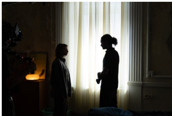
Abb. 7.3.1 Motiviertes Gegenlicht am Fenster

Beim Licht wollte ich keine sichtbare Inszenierung. Vieles basiert auf Fensterlicht und vorhandenen Lampen im Raum. Ich habe versucht, Licht eher zu unterstützen als komplett neu zu setzen. Besonders wichtig war mir eine Szene im Gegenlicht vor Gardinen. Die Figuren sind leicht silhouettiert, aber noch gut lesbar. Dieses leichte „Nicht-ganz-ausgeleuchtet-Sein“ hat für mich gut zur emotionalen Situation gepasst. In den Außenszenen haben wir komplett mit vorhandenem Licht gearbeitet. Das bedeutete weniger Kontrolle, aber mehr Ehrlichkeit. Auch das 3:2-Format hat das Bildgefühl verändert. Es wirkt etwas enger und zwingt dazu, bewusster zu framen. Insgesamt war Licht für mich kein Effektmittel, sondern eher eine Frage der Zurückhaltung.