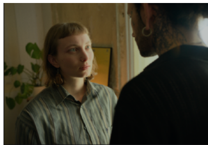
Abb. 7.4.3 Still Frame

merkt, dass Imperfektion im Digitalen möglich ist – aber nur, wenn man sie wirklich will und aktiv gestaltet.