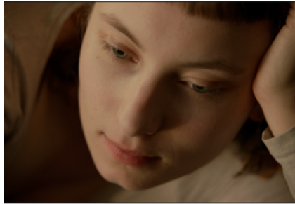
Abb. 7.4.2 Still Frame